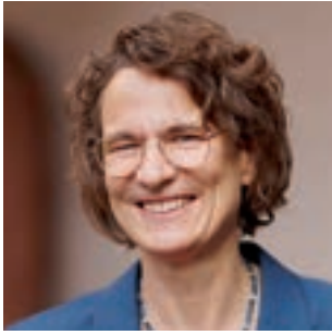
Christiane Tietz Kirchenpräsidentin der Evangelischen Kirche in Hessen und Nassau