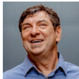
Andreas Winkel Beauftragter der Hessischen Landesregierung für Menschen mit Behinderungen

Viele Herausforderungen warten auf die NRD. Unser gemeinsames Ziel ist das selbstverständliche Miteinander von Menschen mit und ohne Behinderungen. Inklusion eben. Sich für dieses Ziel zu engagieren, lohnt die Mühe!