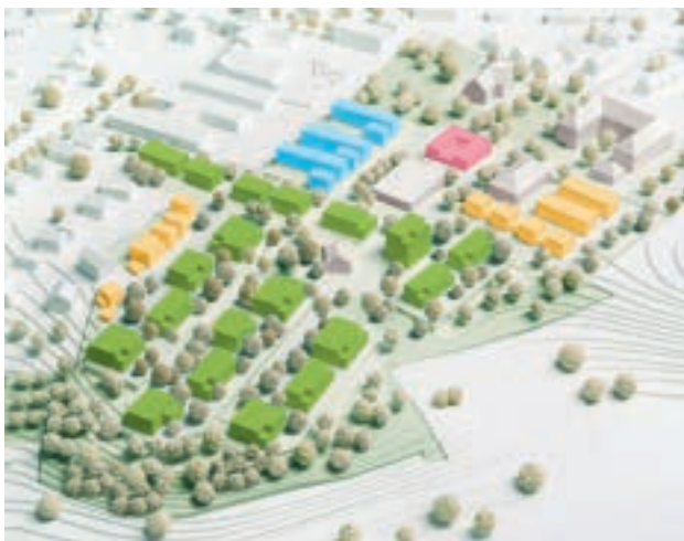
von links nach rechts: Planungsansicht Wohnquartier am Dornberg | Fliednerplatz | Kita Dornberg

Das Ensemble um die Lazaruskirche und das Bodelschwinghaus bleiben das historische Herz der NRD. Trotzdem ist deutlich: Vom Umbau der „alten“ NRD profitieren nicht nur unsere Klient*innen, sondern auch die Menschen in Nieder-Ramstadt, die seit 125 Jahren an unserer Seite stehen.