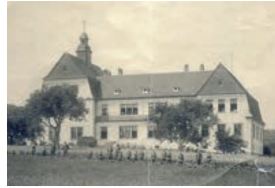
links: Helderich-Haus 2022 oben: altes Helderich-Haus