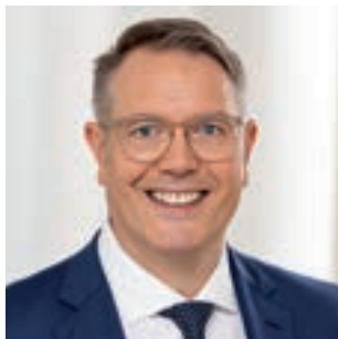
Alexander Schweitzer Ministerpräsident von Rheinland-Pfalz

Als Ministerpräsident möchte ich Sie ermutigen, sich weiterhin mit viel Elan und langem Atem dafür einzusetzen, dass „einfach inklusiv“ zu einer Selbstverständlichkeit in unserer offenen Gesellschaft wird. Es ist noch viel zu tun: Es gibt noch zu viele Barrieren, die wir als Gesellschaft gemeinsam überwindbar machen müssen. Bleiben wir dran – für Selbstbestimmung und Teilhabe aller Menschen!