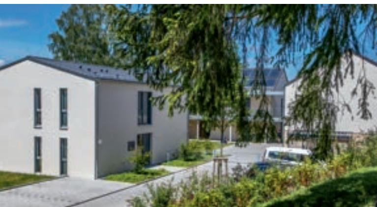
Barrierearmes Ferienhaus Sonnenscheinhaus in Erbach