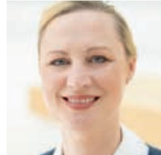
Dörte Schall Ministerin für Arbeit, Soziales, Transformation und Digitalisierung des Landes Rheinland-Pfalz

Ich beglückwünsche die Stiftung Nieder-Ramstädter Diakonie ganz herzlich zu ihrem 125-jährigen Bestehen. Seit dem Jahr 1900 engagiert sich die NRD mit großem Engagement für Menschen mit Behinderungen, junge Menschen und die Altenhilfe – getragen von zahlreichen Akteurinnen und Akteuren. Im Mittelpunkt allen Wirkens steht die Inklusion: die gleichberechtigte Teilhabe aller Menschen, unabhängig von Alter, Lebenssituation oder Beeinträchtigung.