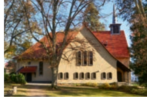
Mittelpunkt der NRD: Die Lazaruskirche